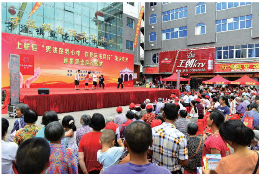
2018 年 7 月 10 日，福建省龙岩市上杭县法学会在才溪镇举行“宪法在我心中，你我与法同行”法治文艺巡回演出启动仪式。

紧紧围绕要求，着力加强协作联动机制，整合资源，创新载体，搭建平台，组织开展多种形式的普法活动。省法学会和省教育厅合作，每年在省内高校定期举办高校法治专场报告会，青年学生积极参与效果显著。创建以省级“法治大讲坛”为龙头，以 9 个设区市和平潭综合实验区具有地方特色的“法治讲坛”为依托的“八闽法治大讲坛”宣传矩阵；与西南政法大学福建校友会联合主办“八闽歌乐法治讲坛”，立足福建、面向全国，打造开放性、公益性的中国特色社会主义政法思想交流平台。各市县法学会还联合教育、团委、司法等部门，组织青年志愿者联合到中小学开展法制教育课，普及法律知识。例如漳州市各中小学广泛开展“宪法晨读”和“宪法主题班会”活动。通过开展“一次法治演讲、编写一份法治手抄报、上一堂普法课、种一片普法林”为“四个一”的系列普法活动，使全市中小学生的法治素养有了质的飞跃。各基层法学会在群众比较集中的休闲广场、文化公园等场所以“图文长廊”“法律宣传板报”“多媒体发映”“趣味猜灯谜”“文艺表演”等方式开展宣传，增强活动的趣味性与实效性。例如龙岩市武平县集中开展以“与民同心，为您守护”为主题的宣传日活动，漳平市组织开展“奉法先锋”活动，与广大市民零距离接触，普及法律知识。