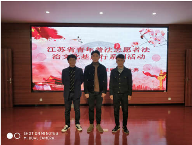
2018年11月30日，江苏省法学会联合有关单位在南京举办第十二届“律苑星辉”高校法律人风采大赛。