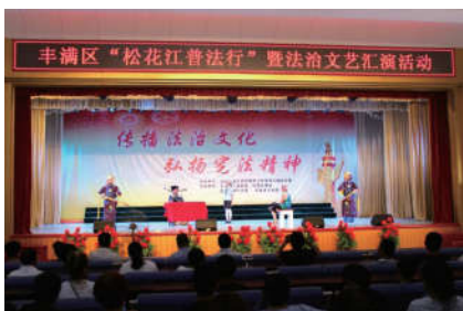
2018年8月10日，吉林省吉林市丰满区法学会和司法局在江南乡建华村文化中心为400多名基层干部和村民举办“松花江普法行”法治文艺汇演。