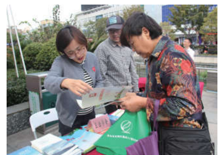
2018年7月12日，浙江省绍兴市法学会举办法治文化基层行宣传活动。

通过法治文化基层行活动，使社会主义法治理念逐步深入人心，领导干部的法治意识进一步增强，广大群众法律素质进一步提高，全社会法治氛围进一步浓厚，为全省经济社会持续健康发展创造了良好法治环境。