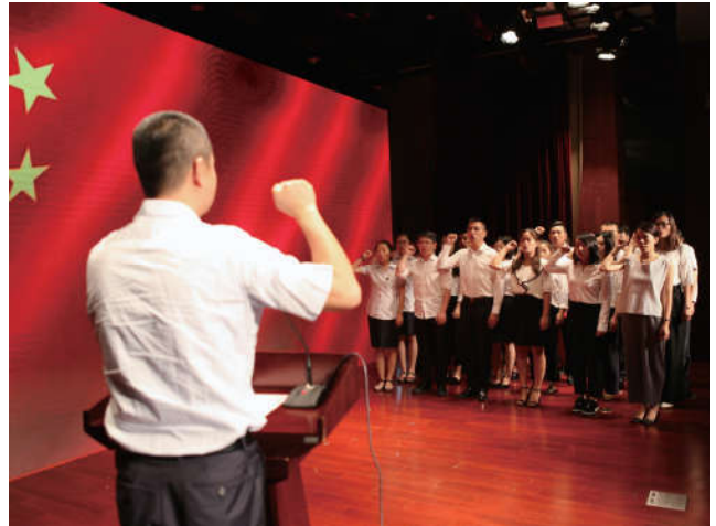
2018年8月8日，上海市闵行区法学会举办“宪法红在闵行”主题学习宣传活动暨普法依法治理宣传月启动仪式——宪法宣誓。

月正式上线以来，粉丝数量6万人，成为普法宣传的重要线上阵地。微信公众号开设了“宪法宣讲”专栏，对宣讲内容进行持续报道，同时还上线了“宪法自测”小程序，为广大党员干部和会员提供学习便利。闵行区法学会在全区范围内以“宪法红在闵行”为主题组织了一系列宪法宣传活动，发放宪法大礼包，开展红色宣讲，组织红色基层行，播放红色短片，组织红色巡演，形式丰富、内容详实、对象广泛、效果显著。嘉定区法学会成功举办了第一届“嘉定法宝杯”讲好中国法治故事全国曲艺展演活动，活动全程网上直播，观看人数超过7200余人。崇明区法学会积极推进“宪法进公交”，在全区范围内开展“弘扬宪法精神建设法治崇明”法治公益广告、“我与宪法”微视频征集大赛。松江区法学会举办了“推进依法行政，优化营