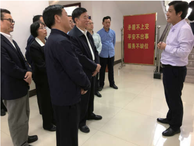
2018年4月10日，中国法学会党组成员、副会长兼秘书长鲍绍坤到浙江省开展新时代“枫桥经验理论总结和经验提升重大课题”专题调研，在诸暨市枫桥镇枫源村调研考察村级民主自治推动乡村振兴工作情况。浙江省检察院贾宇检察长陪同调研。