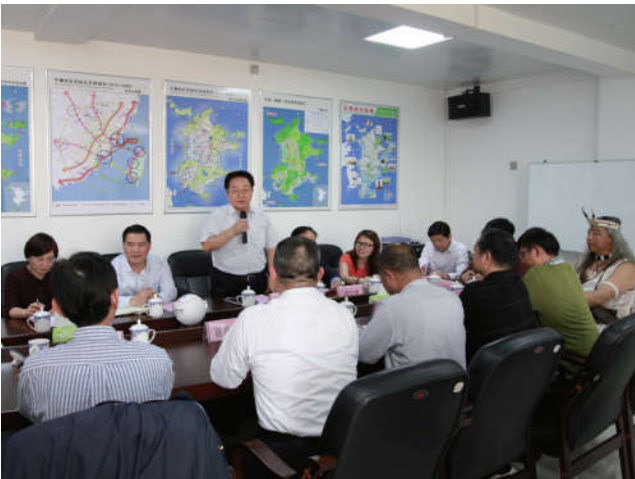
2018年4月10日至12日，中国法学会党组成员、副会长张鸣起率海峡两岸关系法学研究会调研组前往福州、平潭、厦门等地，就“落实台胞同等待遇”进行专题调研。