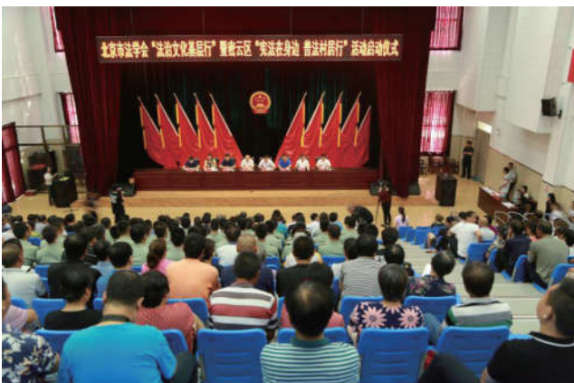
2018年8月10日，北京市法学会、密云区法学会与密云区司法局共同主办的“法治文化基层行”暨“宪法在身边 普法村居行”活动在密云区北庄镇正式启动。

(三) 突出主题，创新形式。紧密结合我市重点工作，始终把服务保障党委政府中心工作作为青年普法项目的重点，大力弘扬社会主义法治精神，繁荣社会主义法治文化，有针对性地选择活动主题和载体，坚持普法工作重心下移，注重创新活动形式，采取群众看得懂、易接受的方式开展青年普法宣传活动。