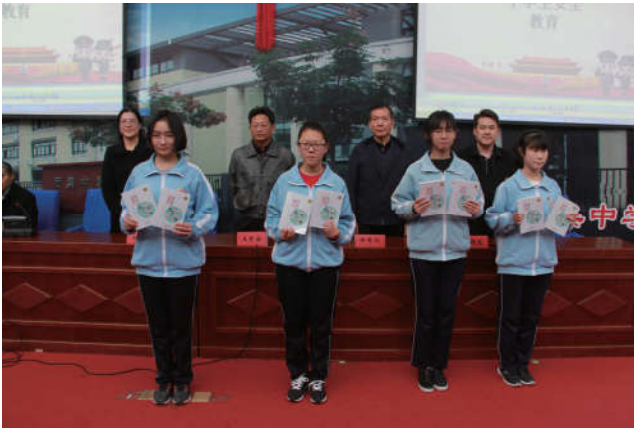
2018年11月12日，北京市法学会法治文化基层行在西集中学报告厅举行“金盾护航健康成长”——2018年通州区百场法治讲座进校园活动。