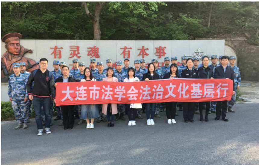
2018年5月3日，辽宁省大连市法学会普法讲师团和东北财经大学法学院的同学为大连91550部队的战士们宣讲法律知识。

三是深入开展以保障和改善民生相关的法律法规学习宣传。围绕人民群众关心关注的热点问题，深入学习宣传与收入分配、社会保障、安全生产、医疗卫生、食品安全和社会救助等相关的法律法规，坚持法治宣传教育与服务群众相结合，努力服务保障和改善民生。