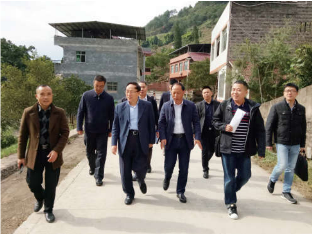
2018年10月22日，中国法学会党组成员、副会长张文显到重庆市开州区竹溪镇石碗村调研脱贫攻坚工作。