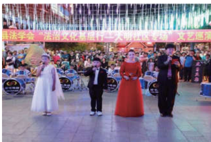
2018年7月12日，吉林省延边州法学会在发明社区举办普法专场文艺巡演。