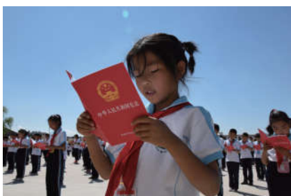
2018年11月19日，吉林省洮南市法学会举办基层行活动——宪法普法。