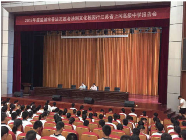
2018年8月22日，江苏省盐城市法学会在高一新生军训期间组织普法志愿者赴全市所有高中、职业中学开展法治文化基层行走进校园活动。