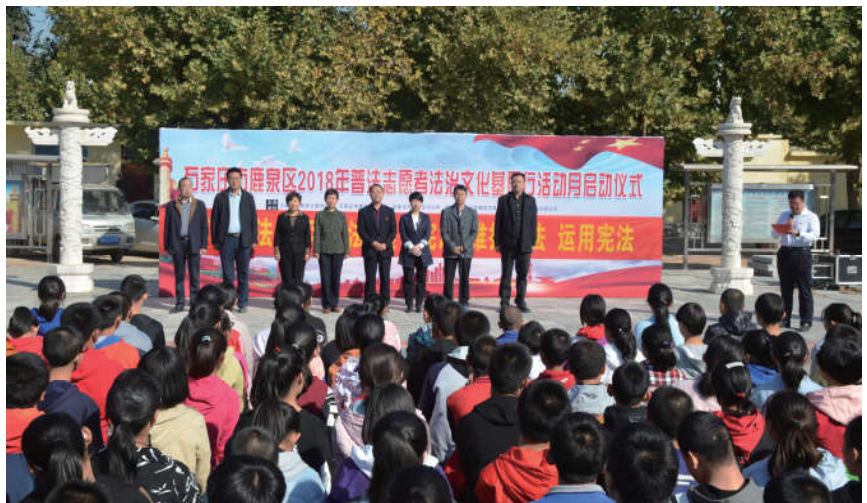
2018年10月10日，河北省法学会在石家庄鹿泉区法治实践基地举办法治文化基层行启动仪式。

三是着力突出服务当前中心工作。为了深入贯彻习近平总书记在民营企业座谈会上的重要讲话和关于民营企业发展的重要指示批示精神，省法学会与工商联共同组织了“民营企业发展与法治保障研讨会”，省法学会和石家庄市法学会组织专家学者到石家庄君乐宝乳业有限公司开展“入企提供法律服务，助推企业良性发展”，专家与企业面对面服务活动。衡水市、巨鹿县、故城县、深州市、景县等法学会组织会员走进乡村、社区、广场、市场等人员密集的场所，通过悬挂宣传标语、现场讲解法律法规、发放扫黑除恶宣传单、设立咨询台等形式，向群众宣传公安机关公布的10类涉黑犯罪及举报