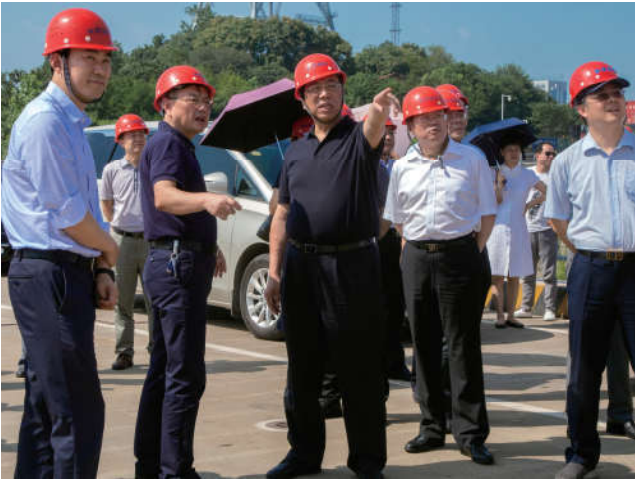
2018年7月11日，中国法学会党组成员、副会长张苏军在湖北省武汉市新港参加2018年第4期“法学家下基层”专题法治调研活动。湖北省法学会党组成员、秘书长王龙，武汉市法学会会长胡绪鹏陪同。