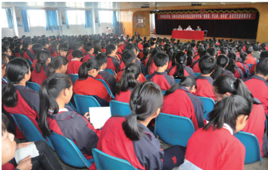
2018年5月23日，安徽省法学会、安顺市法学会在安顺市平坝区红湖中学开展法治文化进校园活动。