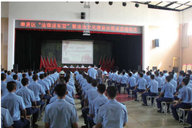
2018年11月1日，上海市奉贤区法学会举办“法律进军营”暨法治文化建设示范点启动仪式。