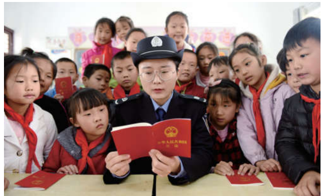
2018 年 4 月 13 日，安徽省马鞍山市含山县法学会与司法局普法工作者在姚庙中心小学开展“弘扬宪法精神”主题宣传活动。

2018 年，全省共开展各类基层行活动 1.5 万余次，参与青年普法志愿者 2.6 万多人次，普法受众 492 多万人次，开展法治讲座 2600 多场，落实普法宣传 4500 余场，开展模拟法庭 344 多次，进行普法服务 1.7 万多场次，发放普法教材 540 万余册。基层行活动覆盖了 14 个省辖市，涉及机关干部、社区街道工作人员、企事业单位职工、大中专院校及中小学学生、普通群众和农村居民等社会人群，法治宣传的普及面进一步扩大，影响力也得到提升。各地加强青年普法志愿者队伍建设，在活动中突出学生、青年、特殊群体和基层干部等重点人群，与政法、综治、维稳和防邪等工作有机结合，科学安排相互促进，既全面推开又突出重点，使