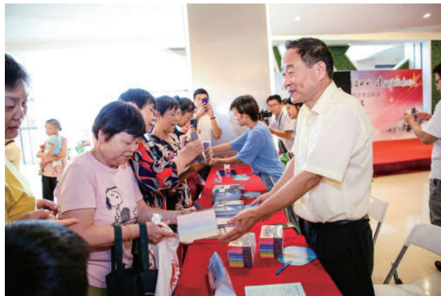
2018年8月16日，上海市松江区法学会举办基层普法、执法联动法律咨询活动。