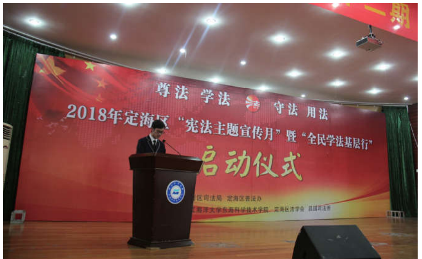
2018年4月18日，浙江省舟山市定海区法学会联合区普法办、区政法各部门在浙江海洋大学东海科学技术学院举办2018年“宪法主题宣传月”暨“全民学法基层行”启动仪式。

行政系统开展“法律服务进千企”活动，组建35个跨律所跨区域专业服务团队，推进法律服务进企业法务无缝对接，举办法律专题培训120场次3400人，围绕产业集聚发展，建成99个重点园区、特色小镇法律服务站。主动参与基层社会治理各项工作，组织协调律师、法官、检察官等会员参与基层社会矛盾化解，服务基层、服务群众。