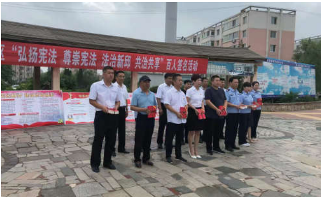
2018年7月25日，辽宁省新邗区法学会在新发街道和谐广场开展“弘扬宪法、尊崇宪法、法治新邗、共治共享”百人签名活动。