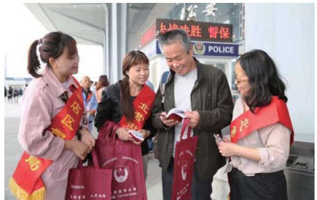
2018年5月20日，山西省太原市小店区法学会联合多个单位组织志愿者在太原南站向乘客发放宪法宣传本。