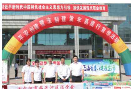
2018年9月20日，黑龙江省委政法委、七台河市法学会、七台河市职业技术学院、七台河市茄子河区法学会、七台河市职业技术学院联合开展茄子河平安创建暨青年普法志愿者法治文化基层行活动。

黑龙江省法学会会长徐明高度重视开展“基层行”工作。徐明会长在深入哈尔滨、齐齐哈尔、牡丹江、大庆、伊春、黑河等地调研时，都认真了解地（市）法学会“基层行”活动开展情况，明确要求市（地）法学会着重抓好“基层行”工作，切实取得法治宣传教育实效。省法学会专职副会长宋忠宪亲自督办抓落实。宋忠宪多次与哈尔滨、齐齐哈尔、牡丹江、大庆、伊春、黑河等地（市）政法委书记、法学会会长、分管法学会的领导当面交流，介绍“基层行”情况，推动“基层行”活动深入开展。宋忠宪多次给“基层行”活动工作进展较慢或者推进有困难的市（地）分管法学会工作的领导打电话，争取他们对法学会工作的支持，及时研究“基层行”活动开展的方式方法，督导“基层行”活动在市（地）实现全覆盖。省法学会建立定期督导制度，分管“基层行”工作的干部每周给十三个市（地）法学会的同志打电话，了解活动进展情况，收集活动开展资料，对地（市）法学会“基层行”开展情况进行全面跟踪问效，确保“基层行”活动的开展不走过场、落到实处。