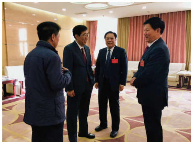
2018年12月25日，中国法学会党组成员、副会长王其江在长春市参加吉林省法学会第八次会员代表大会并讲话。图为王其江与吉林省委书记、省人大常委会主任巴音朝鲁，吉林省人大常委会原常务副主任、省法学会会长马俊清，省政协原常务副主席、省法学会第七届理事会会长李中学进行会谈。