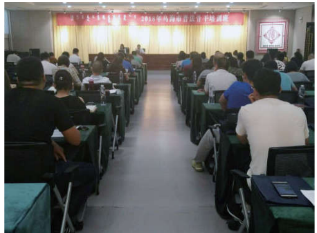
2018年6月22日，内蒙古自治区乌海市法学会在书法艺术馆举办“七五”普法骨干暨宪法专题培训班。

党的十九大提出，全面推进依法治国，总目标是建设中国特色社会主义法治体系，建设社会主义法治国家。我们将以此为契机，进一步加大对普法基层行活动的组织实施力度，使该项活动深入持久、规范有序地开展，创新活动方式，扩展活动效应，以扎实有效的行动，播送法治