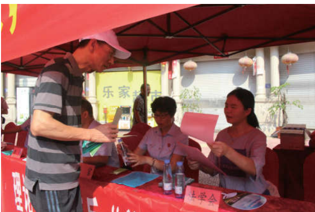
2018年8月3日，福建省宁德福安市法学会联合阳春社区有关部门在安居罗马广场开展“扫黑除恶法治宣传进社区”活动。

加强与新闻媒体的合作，形成协作机制，充分利用“两微一端”等新媒体平台，加大对法治文化基层行活动的宣传推介力度，进一步扩大法治宣讲的社会效应。省法学会与《海峡都市报》合作，开设“都市与法”栏目，与福州法学会合作开通官方微信公众号“闽江法学”，打造法学会新媒体。莆田市在莆田电视台开辟《大家说法》栏目，深度推广莆田法治文化好故事。各地法学会组织开展的法治文化基层行活动，当地报纸、广播、电视、网络等各种新闻媒体都进行了宣传报道，在全社会倡导法治文化，弘扬法治精神，服务法治建设，营造了浓厚的法治氛围。厦门、三明、龙岩等设区市法学会还依托政法部门的各类普法微信公众号等新媒体每月发布法律宣传、平安建设等信息。这些极大地丰富了法治文化基层行活动的形式和内容，增强了法治宣传教育的吸引力和感染力，提升了法治宣传教育的效果。