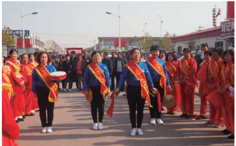
2018 年 11 月 10 日，天津市滨海新区法学会在中塘镇开展“法律赶大集”活动。

构建覆盖城乡的公共法律服务体系，建成四级公共法律服务中心站点和“12348 天津法网”，将便捷专业的公共法律服务送到人民群众身边。着力为创建共建共治共享的社会治理格局提供智力支持。发挥群团优势，畅通法学研究界与实务界特别是社会治理一线行政单位沟通的渠道，打造共建共享平台，强化行政单位工作人员法治思维。