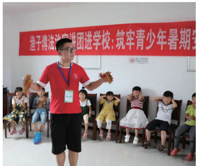
2018年8月，江苏省淮安市淮阴区法学会组织青年普法志愿者开展“关爱未成年人送法进校园”活动。

青年志愿者队伍是开展普法活动的主力军。目前，全省的青年普法志愿者已达到14563人。省法学会组织青年普法志愿者服务团分赴各市、县（市、区）参加法治文化基层行活动；各设区的市法学会都组建了自己的普法志愿者队伍，分别在各自辖区内开展法治文化基层行活动。南通市市级层面整合青年法学专家学者组建青年普法志愿者队，举办两届“江海普法名嘴”评选，整合南通籍“中国好人”中的普法资源建立“中国好人”普法微联盟，形成了具有南通特色“名队名嘴名人”志愿普法队伍。各县（市）区相继成立了“家庭普法站”、普法剧院、个人家庭法治文化室、“普法名嘴”等多支专业普法志愿者队伍，全市形成了涵盖机关部门、医院和学校等企事业单位、行业协会、自由职业者等不同群体的普法志愿者队伍。