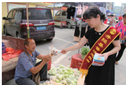
2018年8月8日，河北省石家庄市井陘县法学会组织普法志愿者在街头发放法治宣传材料。

为了使法治文化基层行活动得到深入开展，省法学会高度重视基地建设，积极推动各市区法学会建立稳定的志愿者团队及服务依托平台。加强团队建设，从广大会员中选取了一批优秀青年法学专家组建了宣传团队，积极加强同省法律援助中心、各高校法律援助中心合作，探索新路径、新手段，使基层行活动更有张力。近年来，河北省法学会在全省法学会系统积极推进建立专家服务站。目前，共计436个，其中设区市18个、县级138个、乡镇280个。