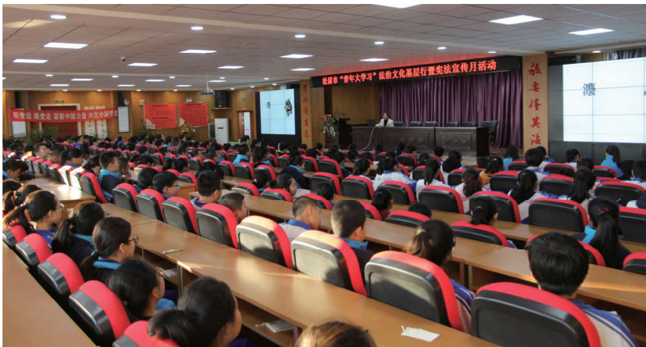
2018年11月7日，吉林省松原市法学会联合团市委开展“青年大学习”法治文化基层行暨宪法宣传月活动。

组织法治文艺演出20场次、组织模拟法庭92次、普法受众人数达100万人、累计发放普法材料200万（册、页）。