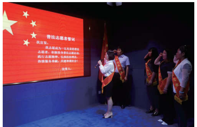
2018年6月15日，北京市卢沟桥乡京辰瑞达大厦的普法志愿者在丰台区“法治文化孵化站”启动仪式上进行普法志愿宣誓。