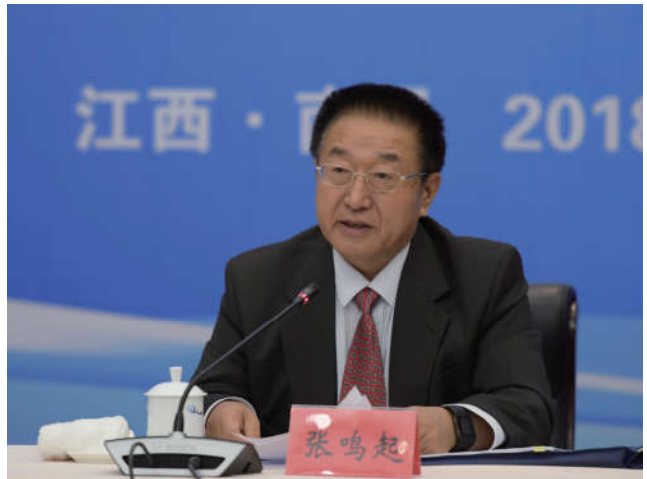
2018年10月25日，中国法学会党组成员、副会长张鸣起出席在江西省南昌市举办的第十一届“中部崛起法治论坛”。