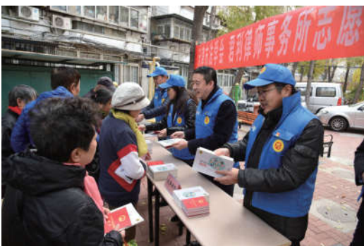
2018 年 11 月 20 日，天津市法学会组织团体会员开展志愿者法治服务进社区活动。