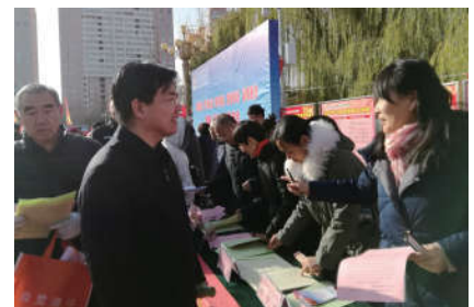
2018年12月4日，河北省法学会宪法学研究会开展普法活动。