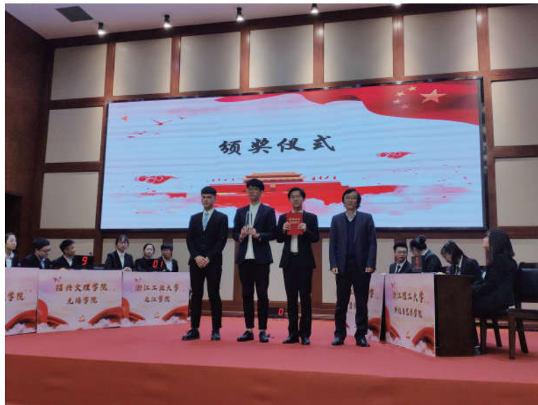
2018年12月1日，浙江省法学会举办各大学法学院学生宪法知识竞赛。

三是突出工作重点。在活动内容上，以全市普法联络员、普法讲师团成员、普法志愿者、社区法律顾问等为主体，紧紧围绕地方党委政府关注、人民群众关心的热点难点问题和改革发展需要以及有利于人民群众法治意识的增强、青少年的健康成长、社会稳定和谐积极开展各项活动。