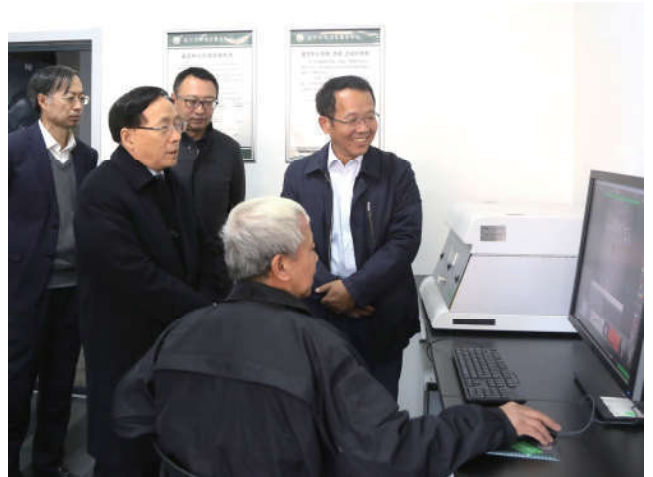
2018年11月18日，中国法学会党组成员、副会长张文显到辽宁大学法学院调研法学教育与司法鉴定工作情况。