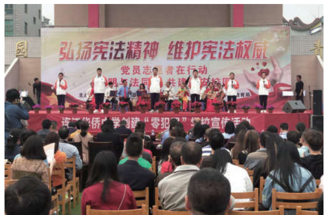
2018年4月13日，福建省连江县法学会在连江华侨中学开展以“文明与法同行，共建平安校园”为主题的普法宣传活动。