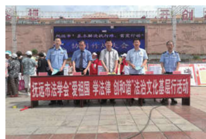
2018年7月15日，黑龙江省抚远市法学会组织多个部门在抚远市人民广场开展青年普法志愿者法治文化基层行活动。