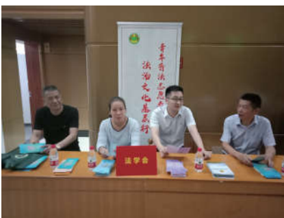
2018年10月12日，浙江省舟山市定海区法学会联合区属相关单位在文化广场开展以“崇尚法治，共创文明”为主题的普法宣传活动。