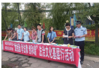
2018年7月24日，黑龙江省鸡西市法学会、鸡冠区法学会在红星乡政府门前联合开展法治文化基层行——法律服务进乡村活动。