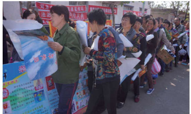
2018年5月10日，辽宁省义县法学会在刘龙台镇举办普法赶大集活动。