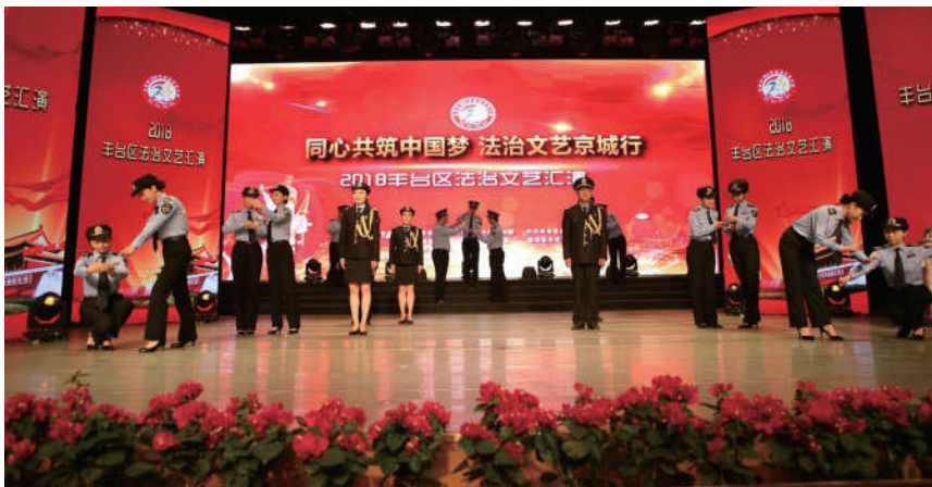
2018年8月17日，北京市丰台区法学会联合药监局组织志愿者在丰台区文化馆表演法治文艺节目情景诗朗诵《使命》。