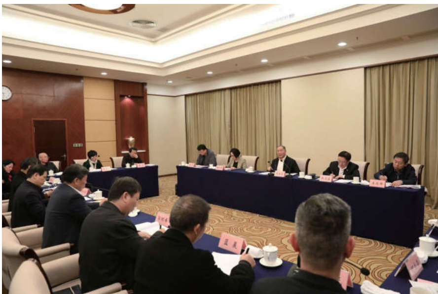
2018年12月16日，中国法学会会长王乐泉出席广西壮族自治区法学会工作调研座谈会并讲话。中国法学会党组成员、副会长张文显，自治区法学会会长温卡华，党组书记、常务副会长李沛芬，党组成员、专职副会长兼秘书长郭环峰出席座谈会。