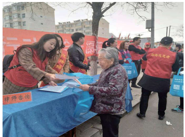
2018年3月1日，内蒙古自治区乌海市法学会、司法局联合哈尔滨社区开展“德耀长河 善行乌海”志愿者服务活动。