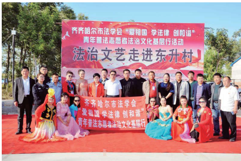
2018年9月16日，黑龙江省齐齐哈尔市法学会在东升村举办普法文艺汇演。

各市（地）法学会按照省法学会的要求，及时制定了“基层行”活动计划并上报省法学会。对于“基层行”活动的开展，各市（地）政法委领导重视，全面部署，将“基层行”活动列为年度重点工作，各市（地）法学会组织全市法学法律工作者和青年志愿者，成立青年普法志愿者服务队，分赴各县区开展“基层行”活动，并在年末对活动开展情况进行了总结检查。各市（地）法学会在工作中与教育局、司法局、团委等部门注重加强协同联动、形成合力，将“基层行”活动与当地开展的法治宣传、普法教育、反邪教宣传警示教育、学生社会实践等活动密切结