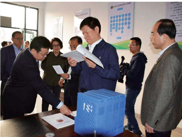
2018年3月31日，中国法学会党组成员、副会长王其江在山东省政法委常务副书记张志华，山东省法学会党组成员、专职副会长兼秘书长任伟陪同下到山东省潍坊市调研法学会工作。