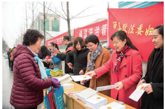
2018年3月8日，山西省晋城市法学会和市妇联举办“三八”维权周活动。

山西省法学会联合省司法厅、团省委印发法治文化基层行活动方案，对各市开展活动进行分类指导，要求各市坚持基层普法工作和当地具体