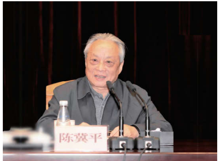
2018年10月27日，中国法学会党组书记、常务副会长陈冀平出席上海市法学会第十一次会员代表大会并讲话。