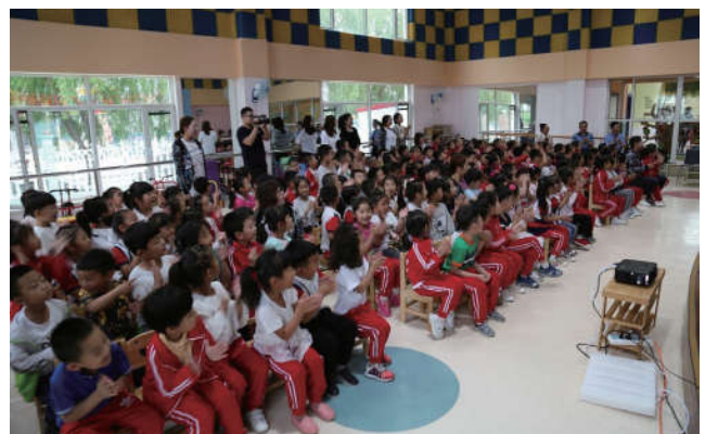
2018年5月28日，辽宁省黑山县法学会在黑山县第一幼儿园进行主题为“献出一片真情，呵护幼小心灵”的法治巡讲。

2019年，我会将继续尽心打造青年普法志愿者基层行品牌，加强建设普法团队使其不断发展壮大，向人民群众讲法律、讲政策、讲时事、讲社情，使宪法意识和法治观念深入人心。继续遵照中国法学会的指示要求，做好服务基层的“强阵地”、“大平台”，讲好法治故事、弘扬法治精神，为人民群众提供全方位、多层次、专业化的法律服务，响应新时代推进全面依法治国的进军令，奋力开创新时代全面依法治国新局面。