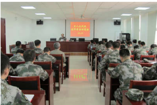
2018 年 4 月 26 日，天津市河西区法学会组织“宪法宣传教育进军营”活动。

坚持把普法基层行活动作为法学会系统服务社会治理的有力抓手，以群众法律思维养成和行政单位法治素养提升作为切入点，发挥普法基层行活动在社会治理中的重要作用。注重开展面向基层群众的法治宣传服务工作。依托全市 243 个街镇级综治信访服务中心、5088 个社区（村）级综治信访服务站开展普法宣传服务活动。充分发动广大会员发挥学科专长优势、结合工作特点，在常规的普法宣传工作基础上，深度参与矛盾纠纷化解、诉前法律咨询、专业法律援助等工作。注重潜移默化化和点滴渗透，将“大水漫灌”式的说教宣传变为“润物细无声”的普法教育。