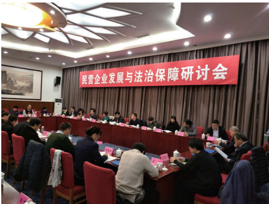
2018年12月13日，河北省法学会与工商联在石家庄共同举办民营企业发展与法治保障研讨会。