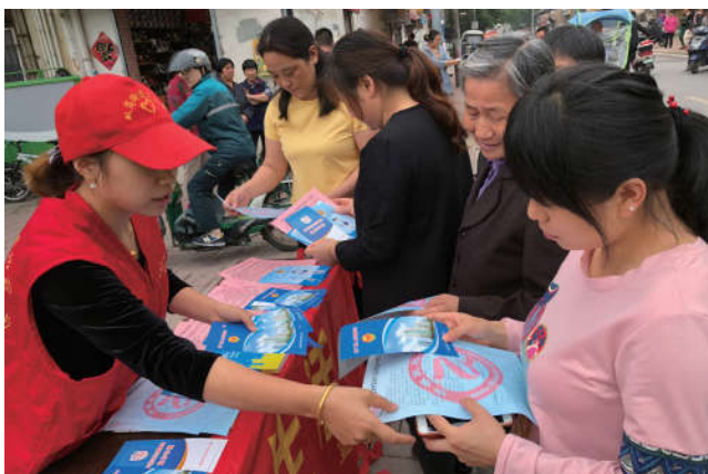
2018 年 5 月 22 日，安徽省合肥市庐阳区法学会组织青年普法志愿者在双岗街道小桥湾社区进行普法活动。

活动有亮点有经验有成效。活动所到之处受到基层群众的普遍好评，大家在活动中深切感受到举办这样的活动很有意义。充分利用微信、微博、微信公众号、微电影等现代传媒，采取群众喜闻乐见活动形式，开展活泼多样的法治宣传活动，提高了群众的法治意识和法律素质以及依法维权、依法表达诉求的能力，为当地经济建设和社会和谐稳定提供了法治服务，营造了全社会尊法学法知法守法用法的良好氛围，有力促进了社会主义法治文化建设和法治安徽建设。