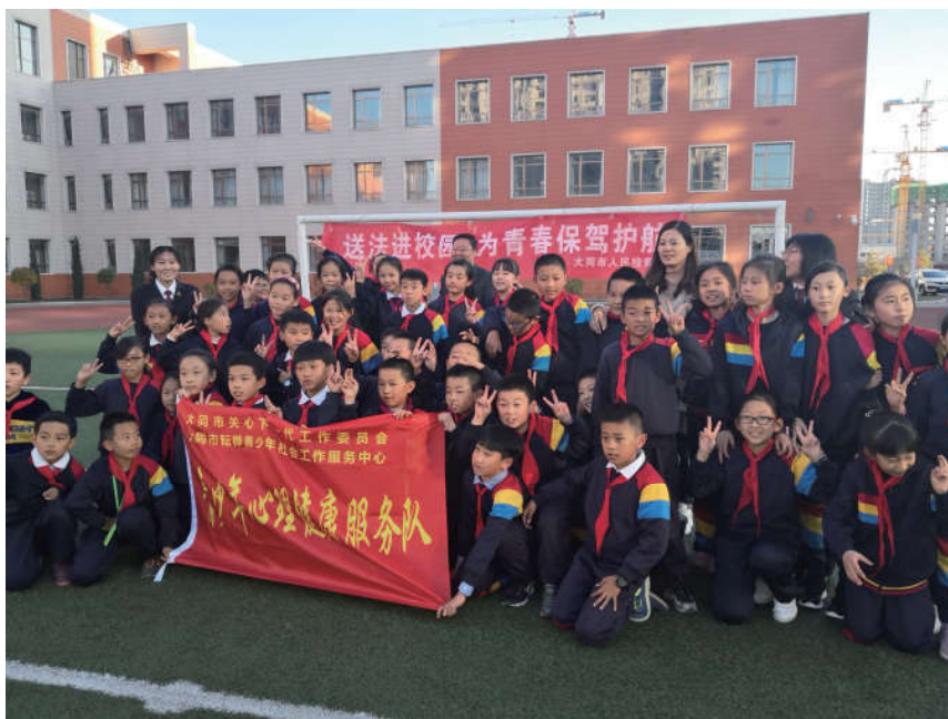
2018年11月12-16日，在山西省大同市法学会的组织下，市检察院在“送法进校园”宣传周为平城区实验小学等10所中小学的学生讲解防拐卖、防性侵、防意外等相关法律常识。

山西省法学会按照中国法学会要求，突出“青年志愿者”和“基层群众”两个主体，注重建立和培养一支常态化、专业化、规范化的青年普法志愿者队伍。朔州市法学会在会员中累计征募了60名青年普法志愿者，成立了朔州市普法志愿者服务大队，以机关公职人员、青少年学生、教师队伍、经营管理者、医务工作者、农村干群、企业职工、特殊人员、老年人、妇女儿童等十类人群为重点宣传教育对象；晋中市