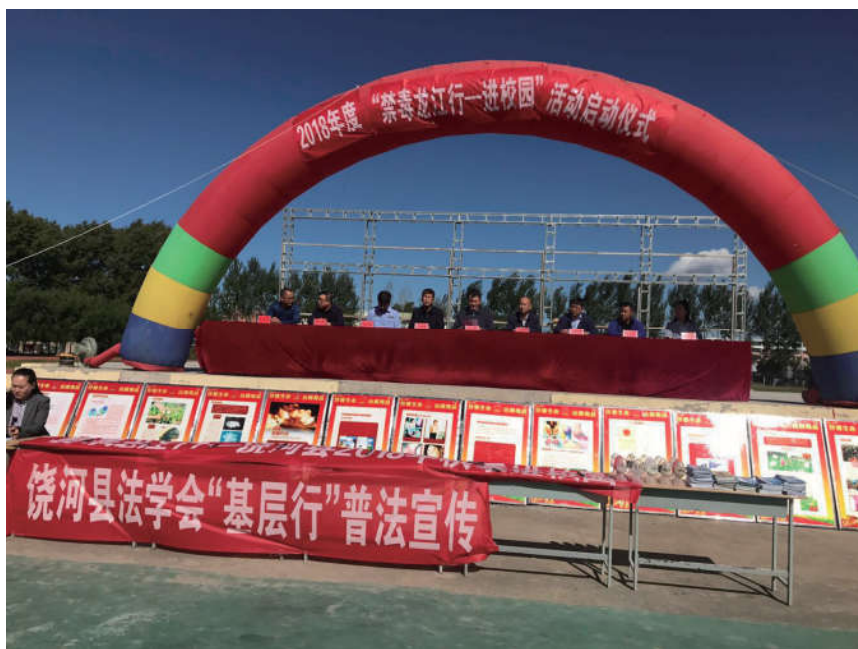
2018年9月17日，黑龙江省双鸭山饶河县法学会举行普法基层行活动进校园启动仪式。

学，为师生和学生进行一次“宪法”专题辅导，把学习宣传《中华人民共和国宪法》的具体举措、宪法学习宣传和贯彻实施的重大意义，通过讲