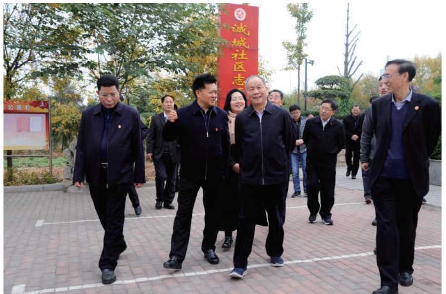
2018年11月9日，中国法学会会长王乐泉在河南省郑州市主持召开五省法学会专题座谈会，强调充分发挥职能作用，为民营经济发展提供法治保障。中国法学会党组成员、副会长、学术委员会主任张文显，中国法学会党组成员、副会长王其江，河南省委副书记、政法委书记喻红秋，河南省法学会会长刘满仓出席会议。会后在河南省辉县裴寨社区辉县法学会法律服务点进行调研。