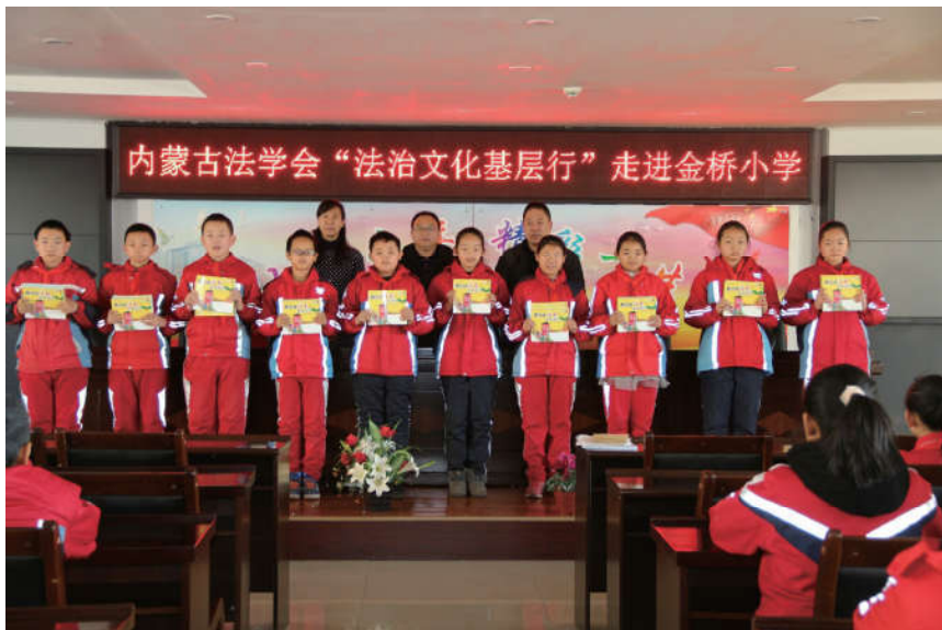
2018年12月13日，内蒙古自治区法学会在金桥小学开展普法宣传活动。