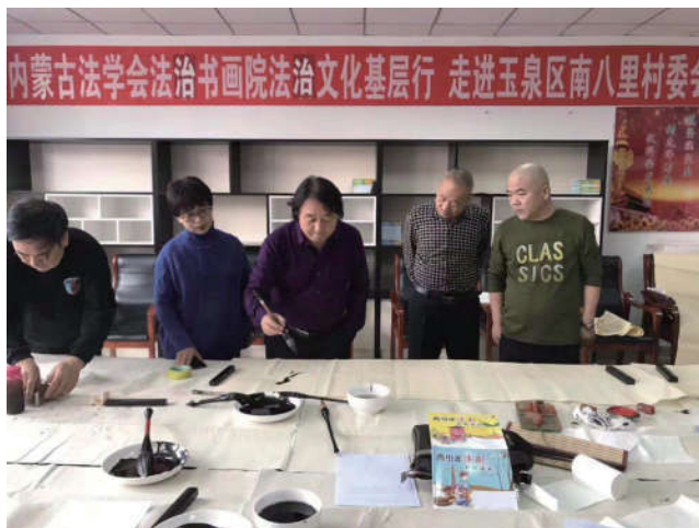
2018年12月4日，内蒙古自治区法学会法治书画院走进玉泉区南八里庄村委会，宣传法治文化。