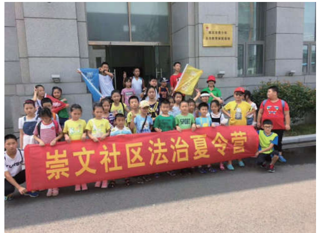
2018年8月18日，江苏省南京市溧水区法学会联合永阳街道崇文社区组织法治夏令营活动。

新生军训之际，市、县普法志愿者举行送法到军训场活动，4万余名高一新生受到法治教育；南京市高淳区法学会联合团区委、区教育局组织有法治教育职能的各部门团组织以及各律师事务所，开展微型法治授课比赛，征集适合中小学生学习的良好法治课程，并以学生当评委的方式，增强校园法治宣传教育的效果和吸引力，增强师生的法治观念。