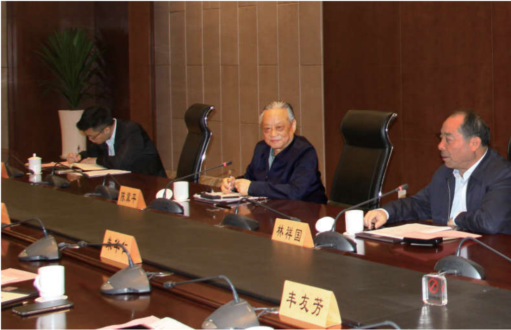
2018年4月20日，中国法学会党组书记、常务副会长陈冀平就如何做好新时代法学会工作到江苏省调研，召开座谈会并讲话。江苏省法学会会长林祥国主持座谈会。