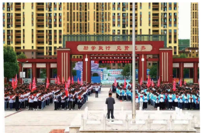
2018 年 9 月 10 日，安徽省宿州市法学会联合法宣办在宿城第一中学组织学生举行宪法诵读活动。