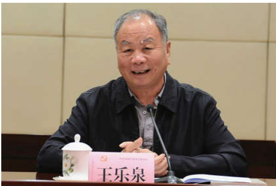
2018年11月10日，中国法学会会长王乐泉出席湖南省法学会工作调研座谈会并讲话。中国法学会党组成员、副会长张文显，湖南省法学会会长孙建国，湖南省法学会党组书记康为民出席座谈会。