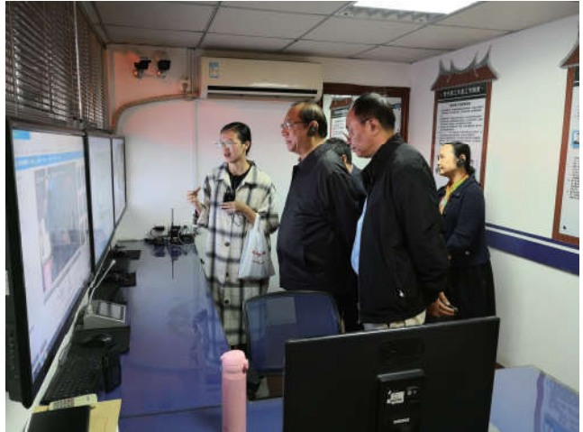
2018年11月1日，中国法学会党组成员、副会长张苏军在福建省厦门市曾厝垵文创村调研。福建省委政法委员会成员、省法学会党组成员、专职副会长何晓清陪同。