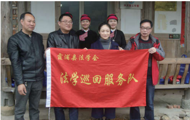
2018年3月26日，福建省霞浦县法学会组织法学巡回服务队进畲村开展法律服务活动。